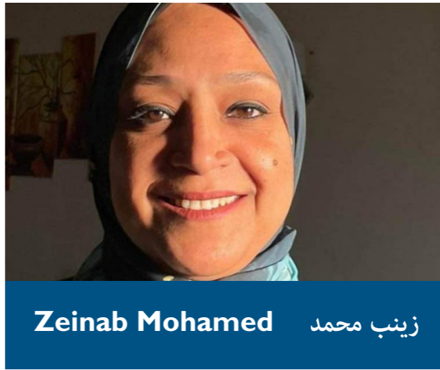
Zeinab Mohamed زينب محمد

رأس تمثال غير مكتمل للملكة نفرتيتي منزل رقم O47.20 ، آخت-آتون (العمارنة) عصر العمارنة (حوالي 1333-1350 ق.م.) - الدولة الحديثة جمعية استكشاف مصر موسم 1932-1933م كوارتزيت بني ملون، ارتفاع 36 سم، عرض 11 سم، طول 17 سم سجل عام: 59286 - سجل خاص القسم الرابع: 13226